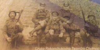
Grupa Rekonstrukcyjna Twierdzy Chełmno