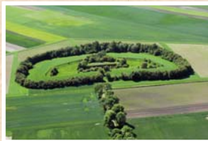
Fort I Watorowo im. Zielińskiego