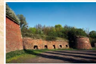
II Bastion Cytadeli Grudziądz

kształt grup fortecznych, tzw. fortw rozproszonych, jednych z pierwszych tego typu w niemieckiej szkole fortyfikacyjnej, gdzie dużą wagę przykładano do maskowania. Kolejna rozbudowa umocnień przypadła na okres mobilizacji wojennej w latach 1914-1915; wybudowano wtedy 32 schrony ziemne oraz kilkanaście obiektów zaplecza. W sierpniu 1939 roku Wojsko Polskie umocniło twierdzę o tzw. Linie Osy, wznosząc 11 schronów bojowych. Kolejna niemiecka rozbudowa mobilizacyjna z lat 1944-1945 wzbogaciła miasto i okolice o ponad 60 dodatkowych małych schronów bojowych typu „Tobruk” i kilka schronów biurowych, z czego większość zachowała się do dnia dzisiejszego.