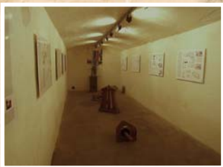
Skansen forteczny - Bateria AB IV